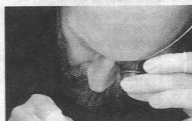
Ohne Lupe geht gar nichts.